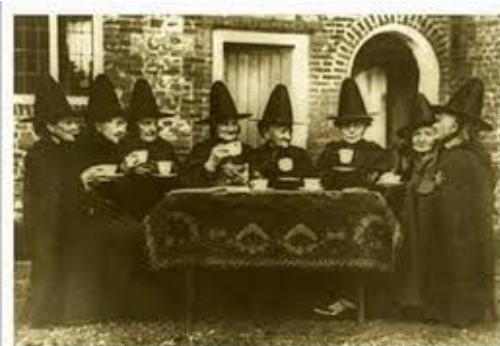
Les sœurs de la sorcière du placard aux balais.

Les répétitions se dérouleront au Carré Sévigné et dans les locaux de l'école de musique (ancienne gendarmerie) du mardi 11 mars au vendredi 14 mars. La journée de stage du samedi 15 mars se déroulera à l'auditorium du centre culturel.